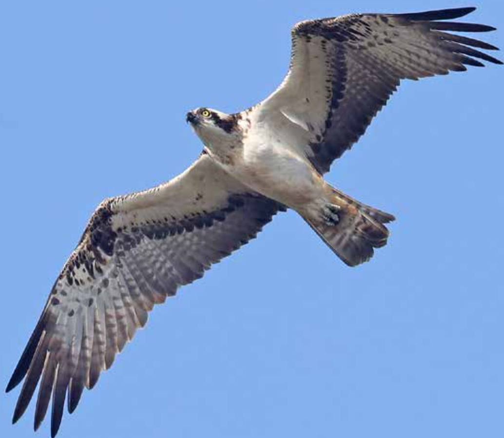
Visarend, telpost Berkheide, Wassenaar, 25 mei 2018 | RENÉ VAN ROSSUM