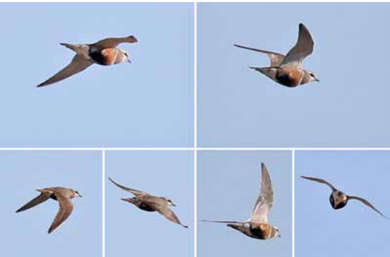
Morinelplevier , telpost Berkheide, Wassenaar, 15 mei 2018 | RENÉ VAN ROSSUM