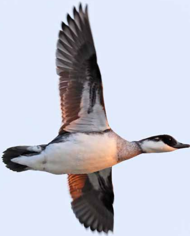
Nonnetje ♀, Buitenwatering, Katwijk aan Zee, 2 maart 2018 | RENÉ VAN ROSSUM