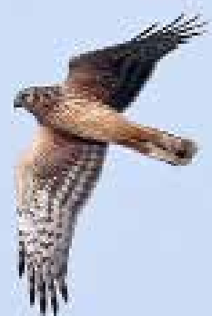
Blauwe Kiekendief , telpost De Puinhoop, Coepelduynen, Katwijk aan Zee, 5 november 2018 | RENÉ VAN ROSSUM