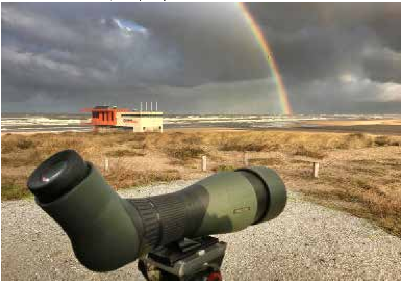
Telpost Savoy, Katwijk aan Zee, december 2018

In 2018 werden er 214:01 teluren gemaakt, verspreid over 58 dagen in de maanden augustus, september, oktober en november. De meeste teluren werden gemaakt in oktober (70:50 uur), gevolgd door september (60:40 uur), november (46:00 uur) en uiteindelijk augustus (36:31 uur). In totaal vlogen er 935.607 vogels langs, betreffende 154 vogelsoorten (162