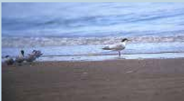
Sierlijke Stern , op strand nabij de Wassenaarse Slag, 9 juni 2002 | PIETER THOMAS

Dit betekent dat per 2018 Katwijk met terugwerkende kracht ook een nieuwe soort rijker is. Op die bewuste 9 juni 2002 werd door vogelaars waargenomen dat de vogel in het begin van de middag wegvloog richting noord en uit beeld verdween ergens voor de kust van Berkheide. Op dat moment