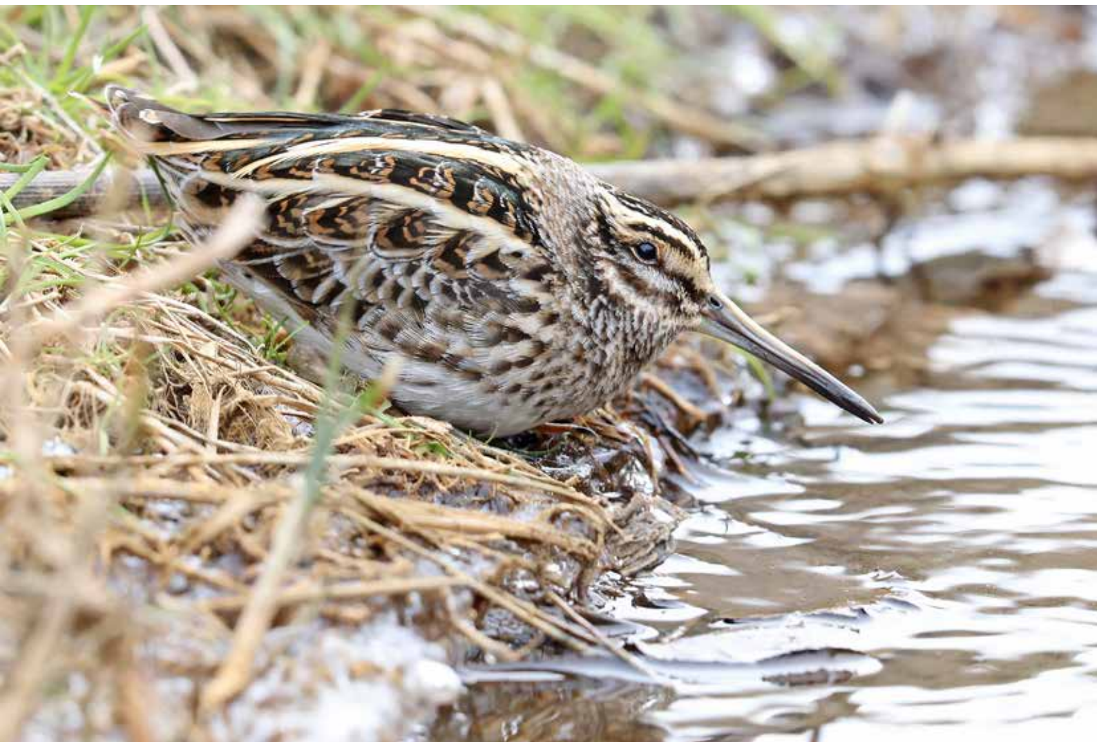
Bokje , De Mient, Katwijk, 1 maart 2018