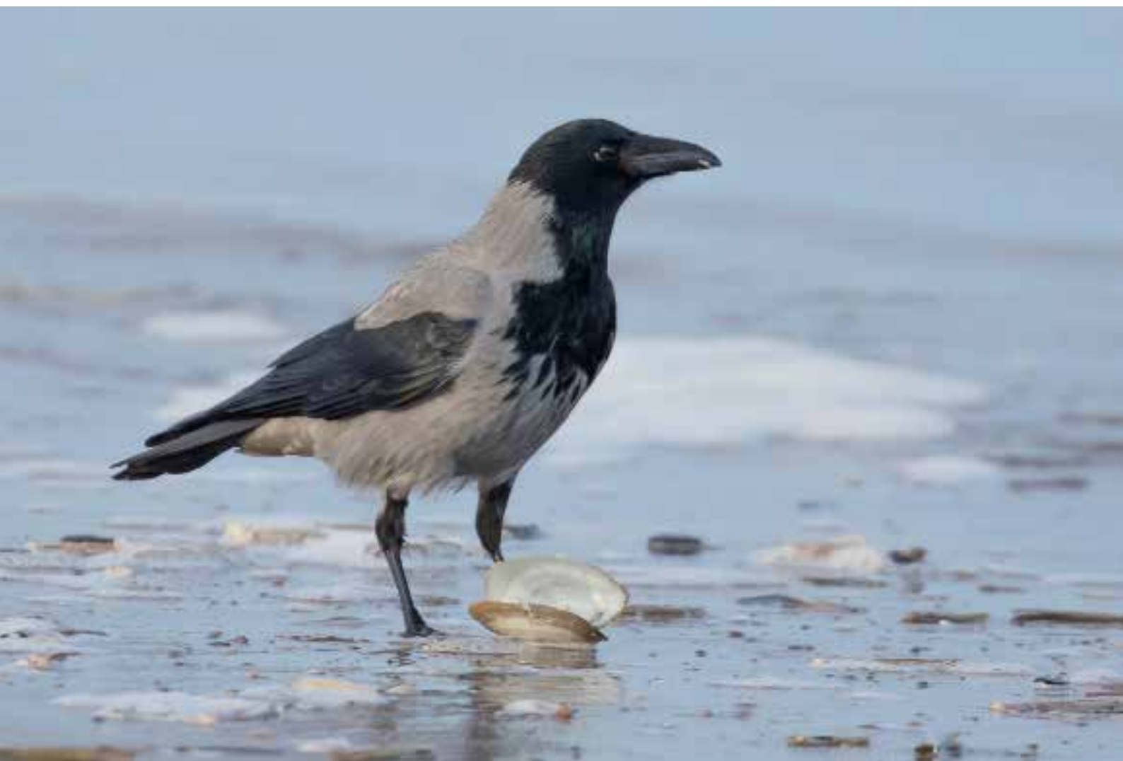
Bonte Kraai , strand Katwijk/Wassenaar, 21 januari 2018 | SJAAK SCHILPEROORT