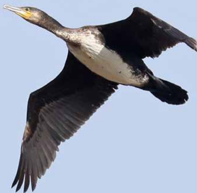
Grote Aalscholver , telpost Berkheide, Wassenaar, 10 april 2018