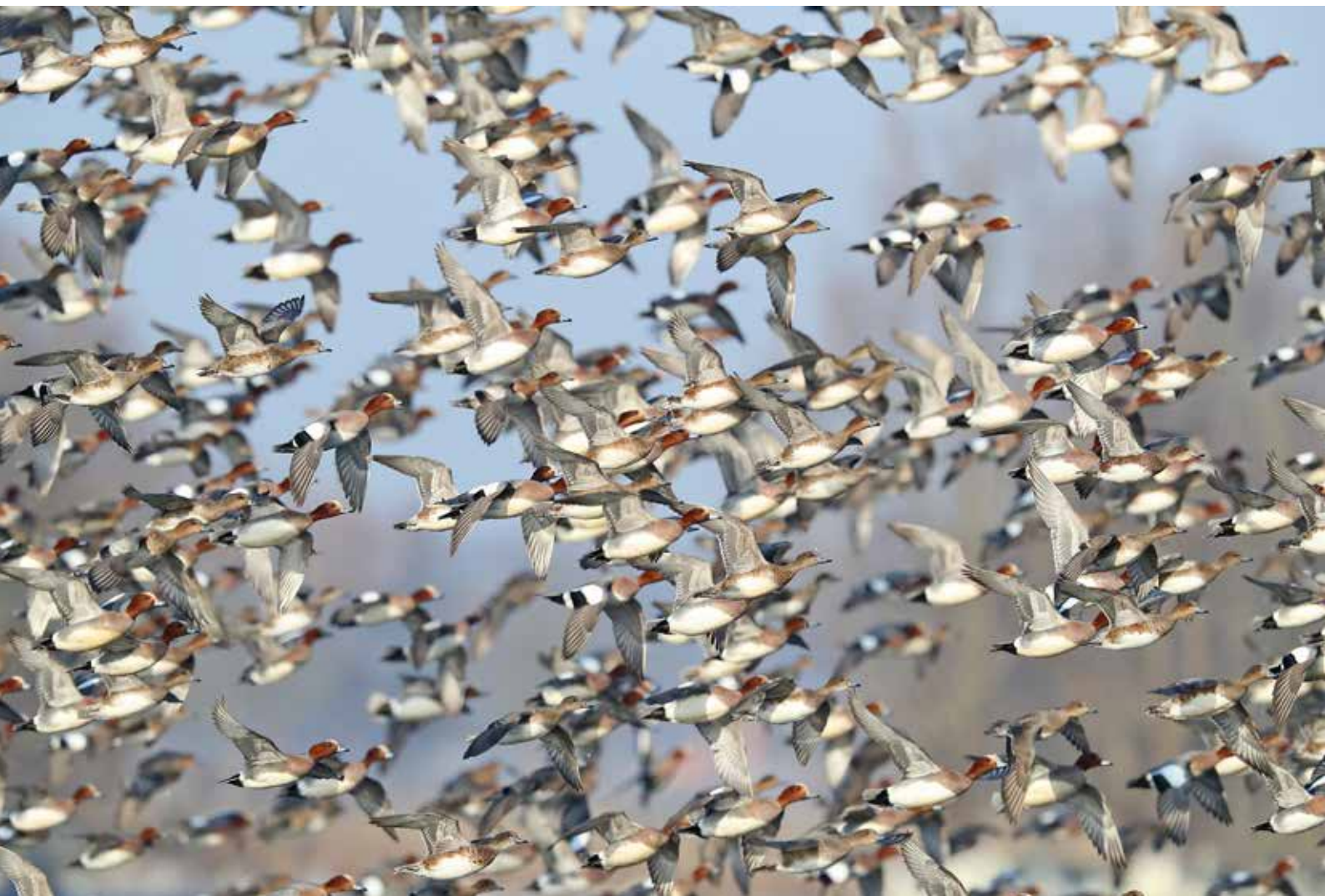
Smienten, Valkenburgse Meer, 2 maart 2018