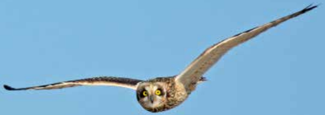
Velduil , Coepelduynen, Katwijk / Noordwijk, 15 oktober 2018