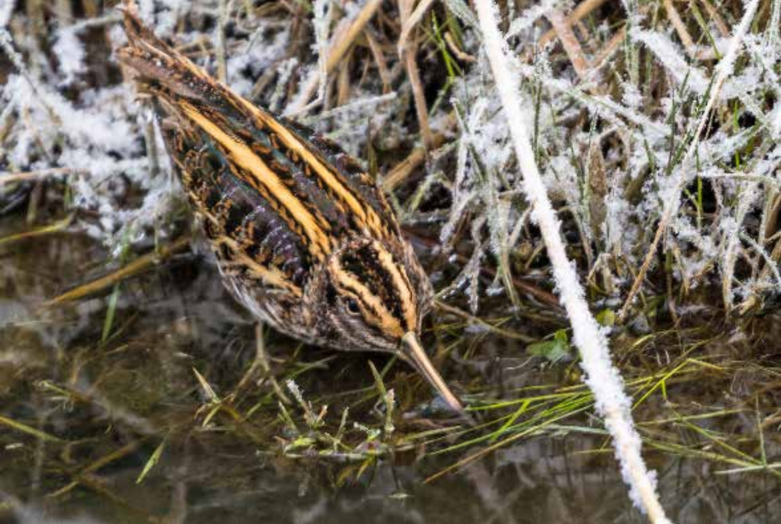
Bokje , Lentevreugd, Wassenaar, 28 februari 2018 | THUIS SCHIPPER