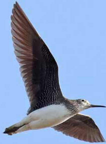
Witgat , telpost Berkheide, Wassenaar, 19 april 2018