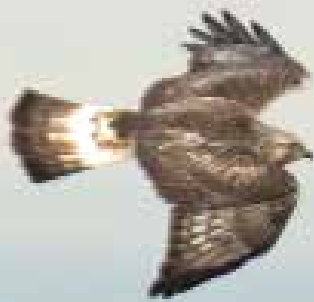
Ruigpootbuizerd , Coepelduynen, Katwijk / Noordwijk, 1 november 2018 | JOOST VAN DER SLUIJS