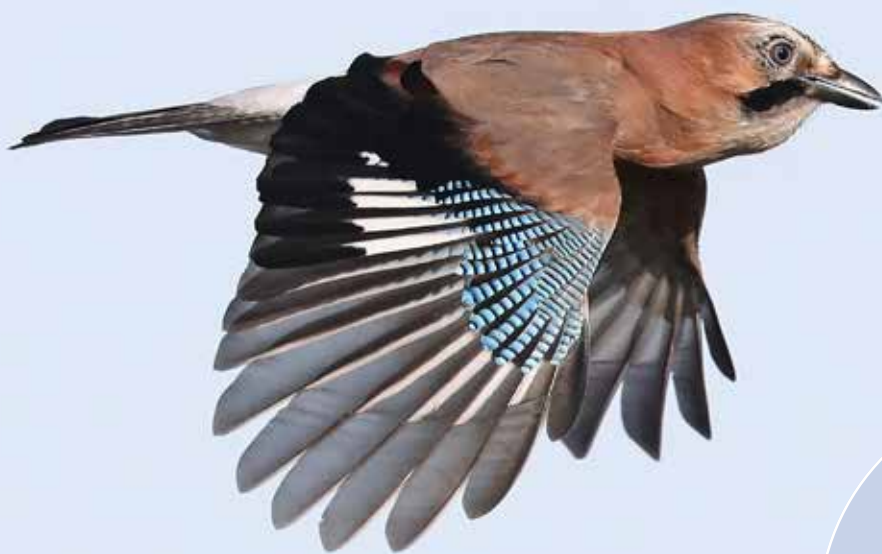
Gaai , telpost De Puiinhoop, Coepelduynen, Katwijk aan Zee, 12 oktober 2018