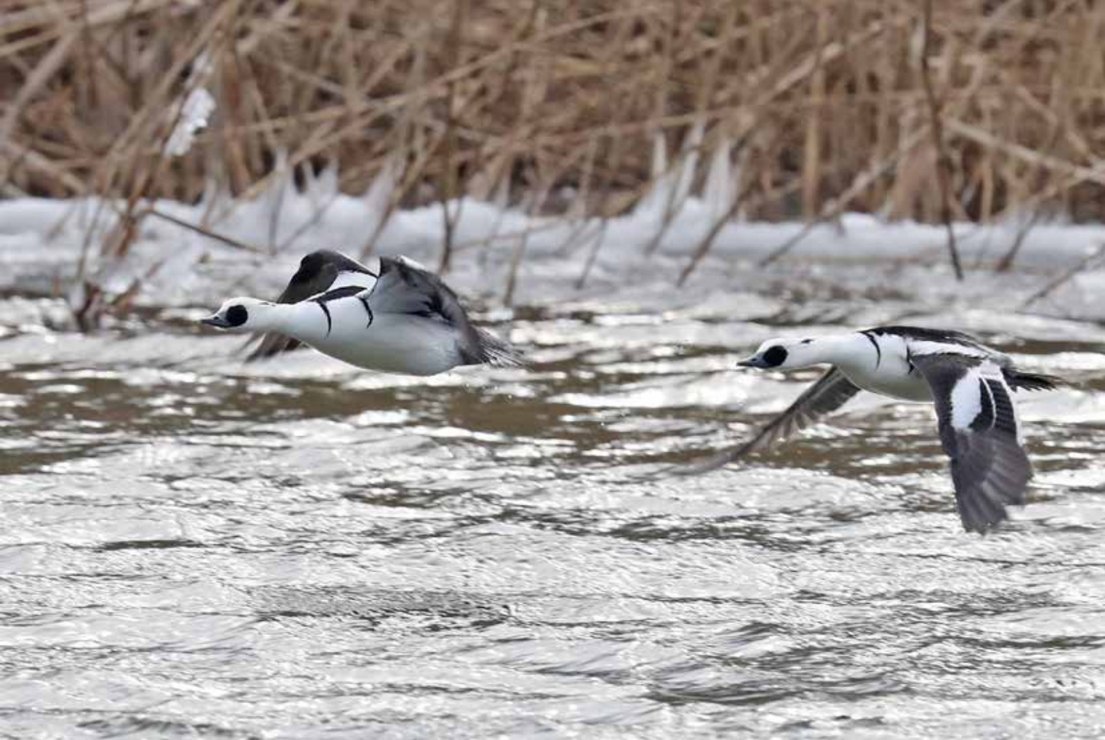
Nonnetjes ♂, Berkheide, Katwijk aan Zee, 2 maart 2018