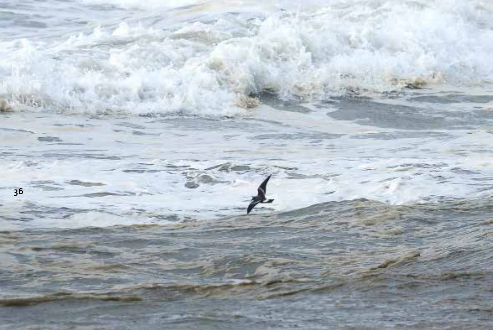
Vaal Stormvogeltje, telpost Savoy, Katwijk aan Zee, 26 oktober 2018