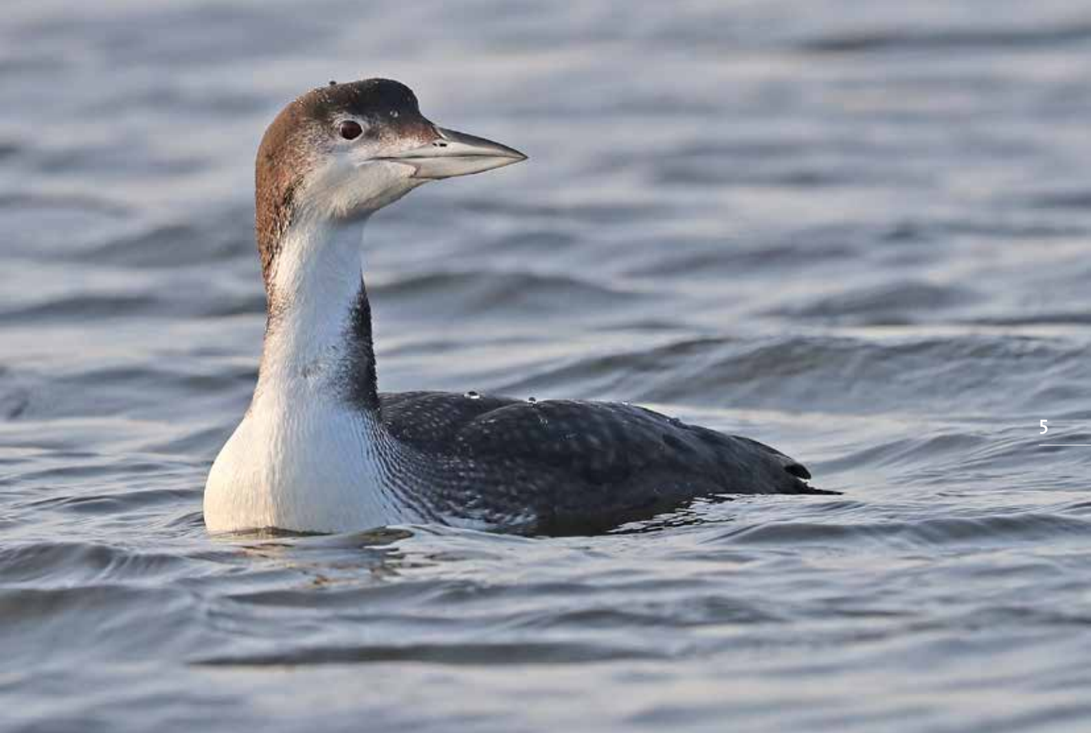
IJsdijker, Valkenburgse Meer, Valkenburg, 14 januari 2018