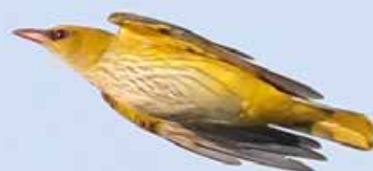
Wielewaal ♀, 06.58 uur, telpost Berkheide, Wassenaar, 26 mei 2018

op 13 territoria in Lentevreugd en Berkheide. Van elders zijn geen 'broedgegevens' bekend.