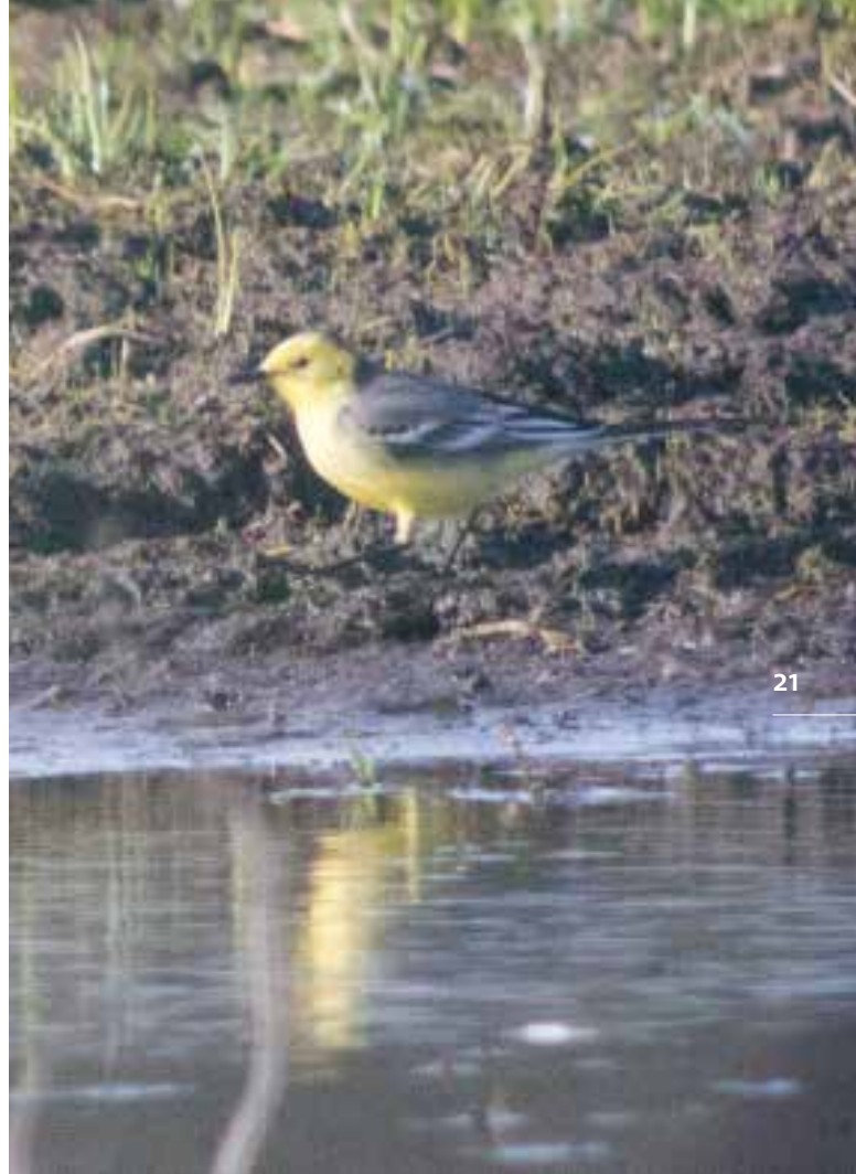
Citreengkikstaart ♂, Lentevreugd, Wassenaar, 17 april 2018

Dit jaar slechts twee waarnemingen van trekkers: 16 maart 2 ex naar noord, 11 september 1 ex naar zuid over zee.