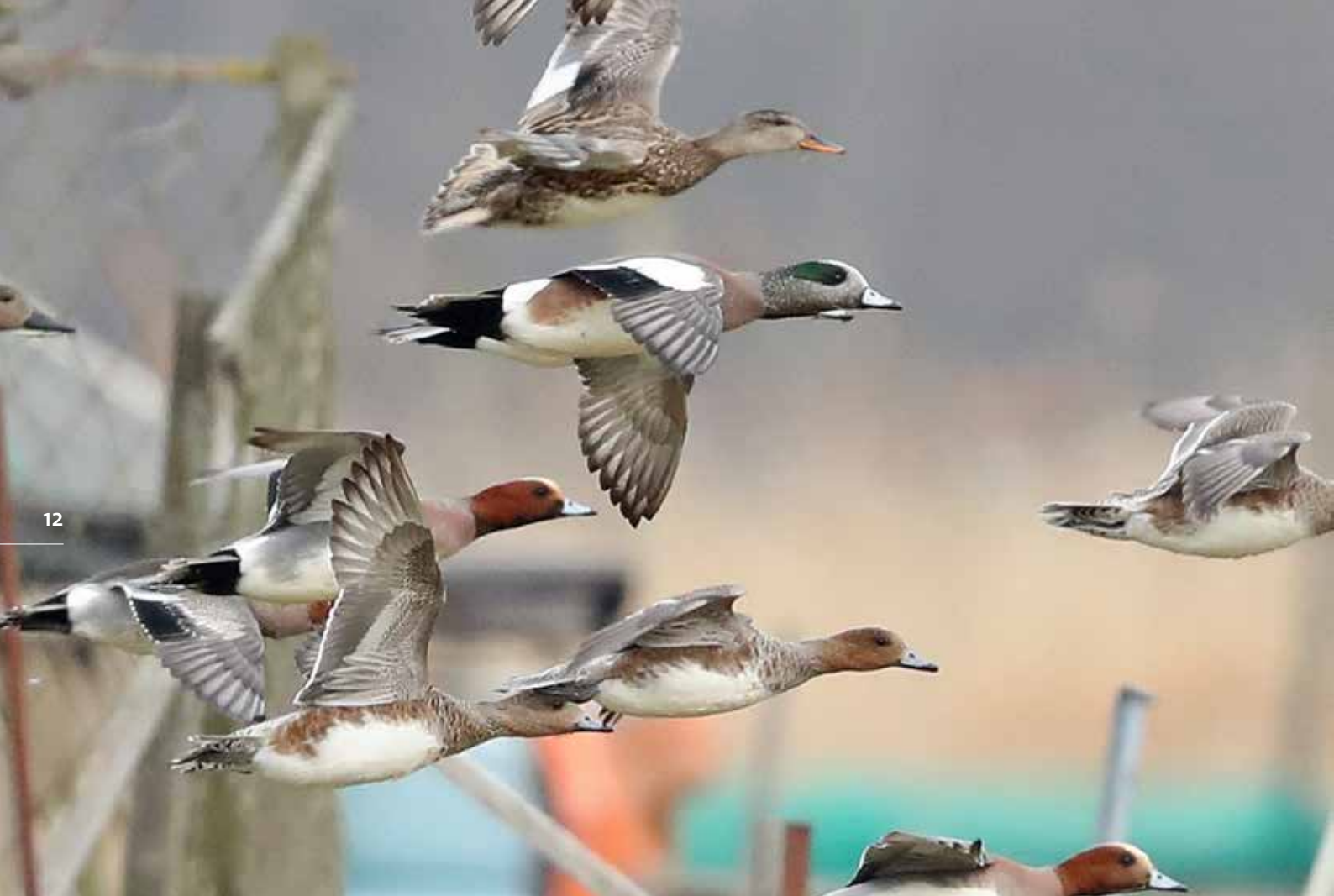
Amerikaanse Smient ♂ samen met Smienten en Krakeenden, De Mient, Katwijk/Wassenaar, 1 maart 2018