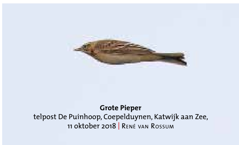
Grote Pieper telpost De Puihoop, Coepelduynen, Katwijk aan Zee, 11 oktober 2018 | RENÉ VAN ROSSUM