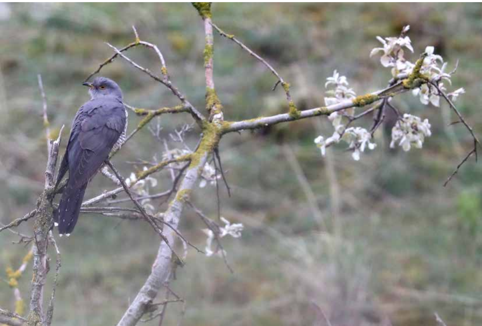
Koekoek , nabij telpost Berkheide, Wassenaar, 29 april 2018