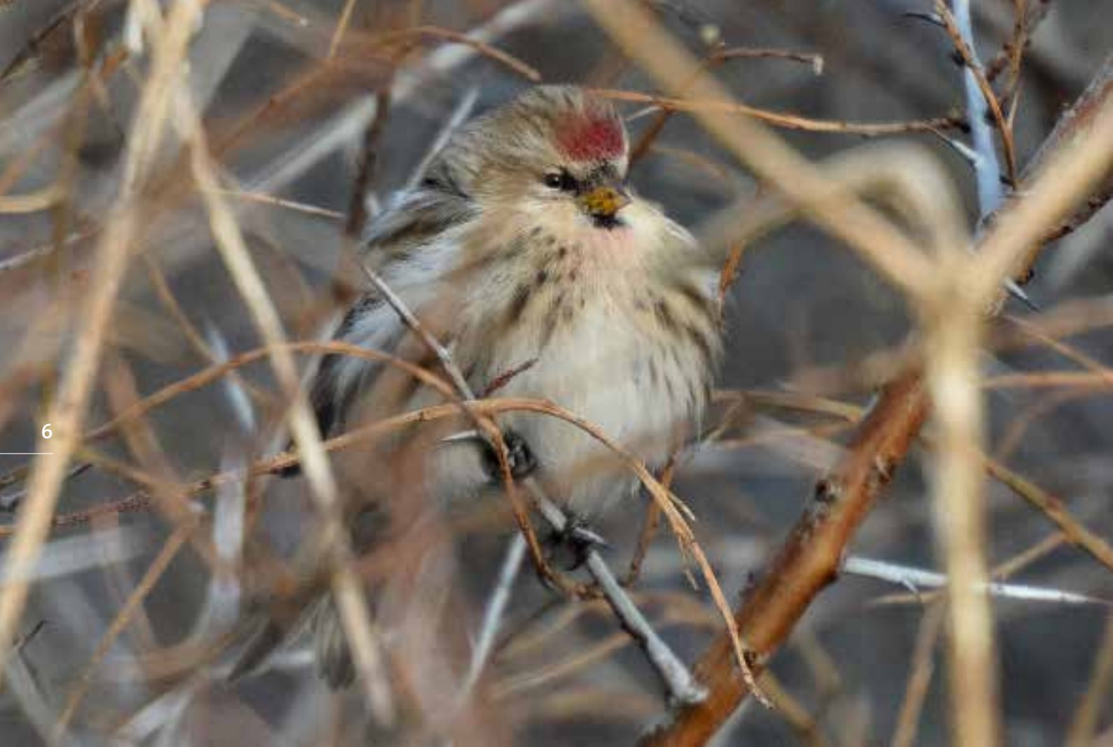
Grote Barmsijs , Lentevreugd, Wassenaar, 9 januari 2018