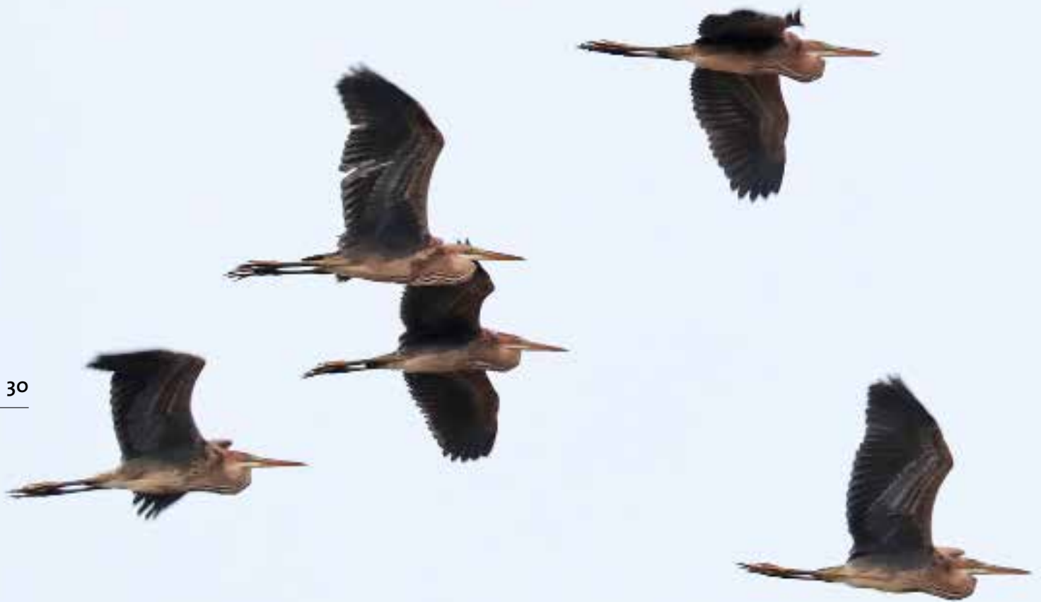
Purperreigers, onvolwassen ex, telpost De Puinhoop, Katwijk aan Zee, 12 augustus 2018