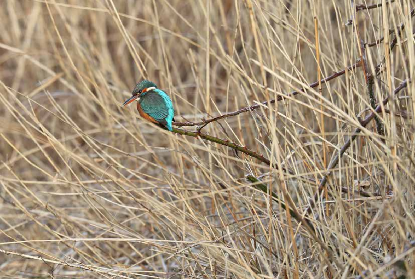
Ijvogel ♀, Lentevreugd, Wassenaar, 27 februari 2018 | RENÉ VAN ROSSUM