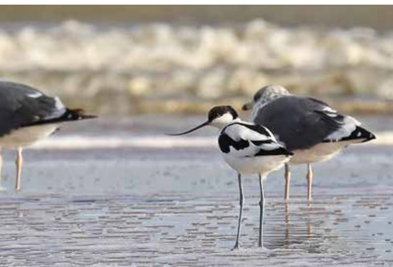
Kluut , strand nabij Buitenwatering, Katwijk aan Zee, 24 september 2018