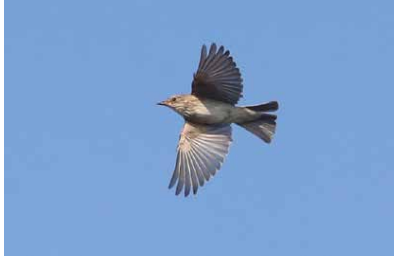
Grauwe Vliegenvanger , telpost Berkheide, Wassenaar, 25 mei 2018