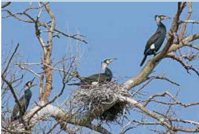
Aalscholvers, Berkheide, Wassenaar, 17 maart 2016