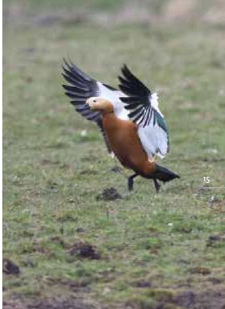
Casarca, De Mient, Katwijk, 24 maart 2018 | JAAP ENGBERTS