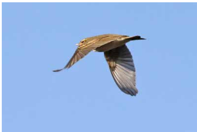
Siberische Boompieper telpost De Puihoop, Coepelduynen, Katwijk aan Zee, 12 oktober 2018