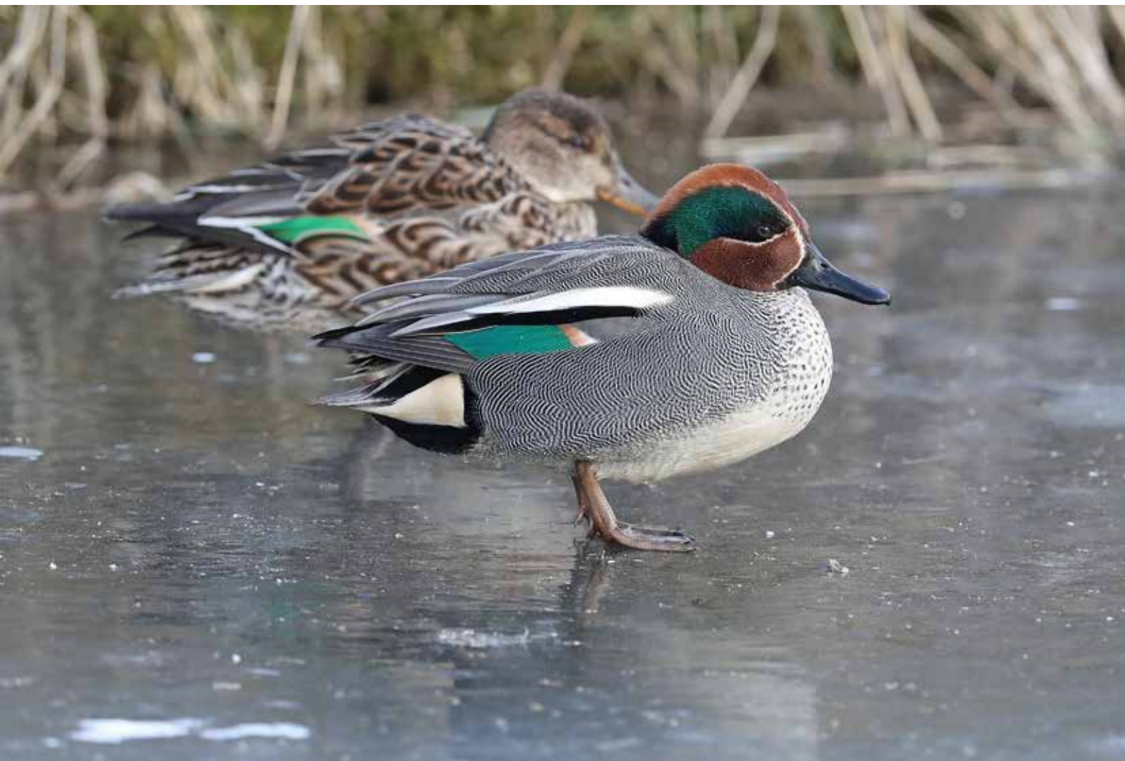
Wintertaling ♀ ♂, Lentevreugd, Wassenaar, 1 maart 2018