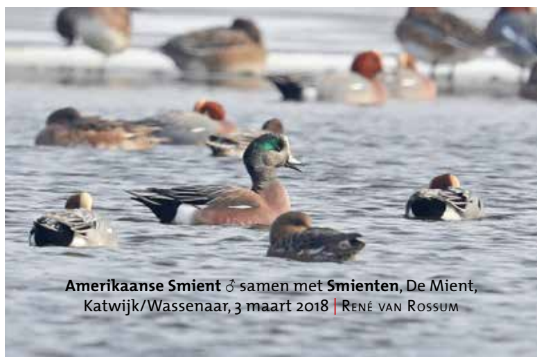
Amerikaanse Smient ♂ samen met Smienten , De Mient, Katwijk/Wassenaar, 3 maart 2018