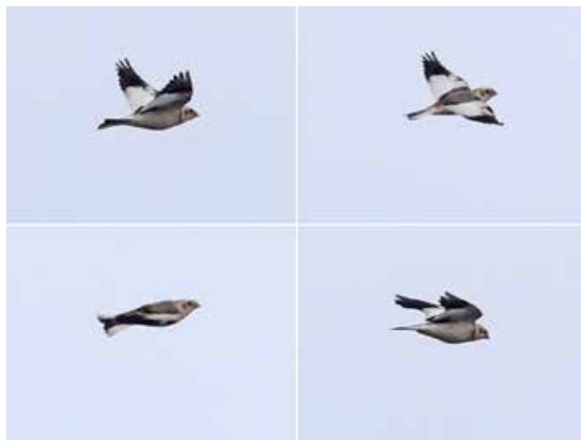
Sneeuwgorz, telpost Berkheide, Wassenaar, 7 maart 2018

Een mooie groep van 15 ex trok op 20 februari lang Trektepost Berkheide, waar op 7 maart ook een mannetje langs vloog. Op 11 en 23 februari was 1 ex aanwezig bij de Buitenwatering. Vanaf november werden er weer Sneeuwgorzen langstrekend gemeld, en vanaf 23 november werden er regelmatig