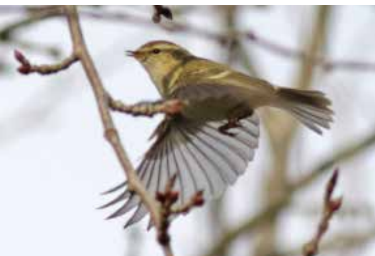
Humes Bladkoning , Rijnsoever, Katwijk aan Zee, 27 december 2018