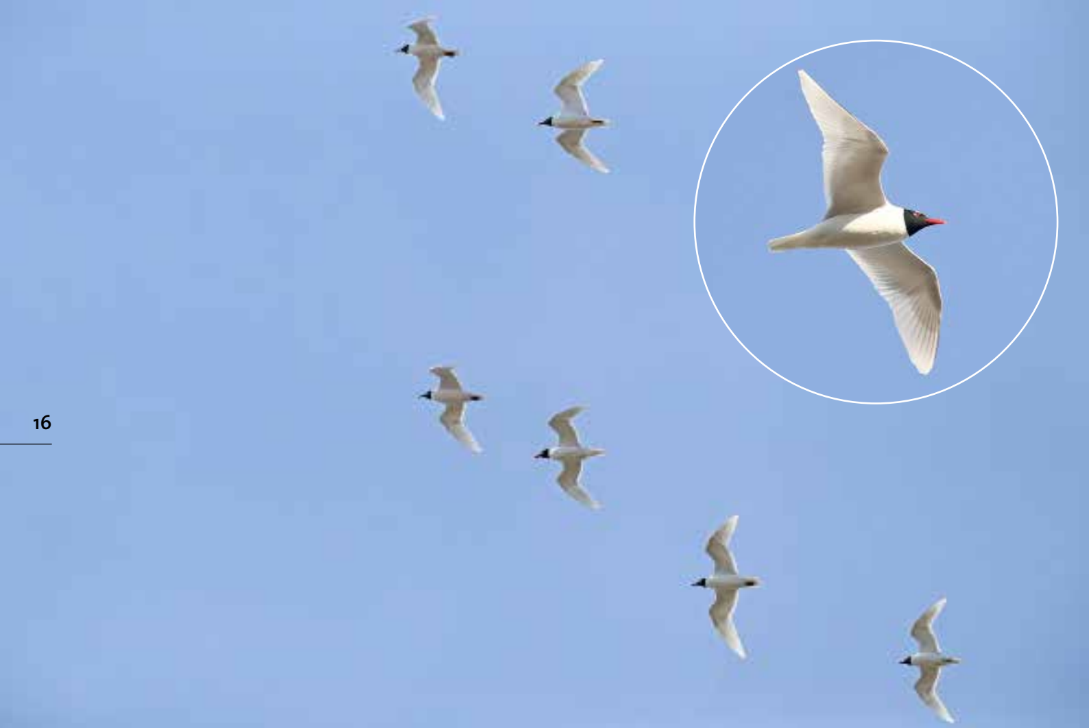
Zwartkopmeeuwen , telpost Berkheide, Wassenaar, 19 april 2018