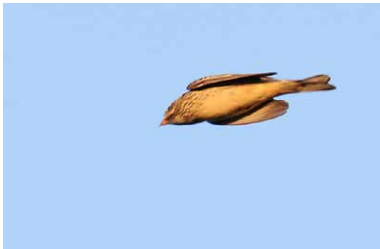
Ortolaan , telpost De Puinhoop, Katwijk aan Zee 18 september 2018