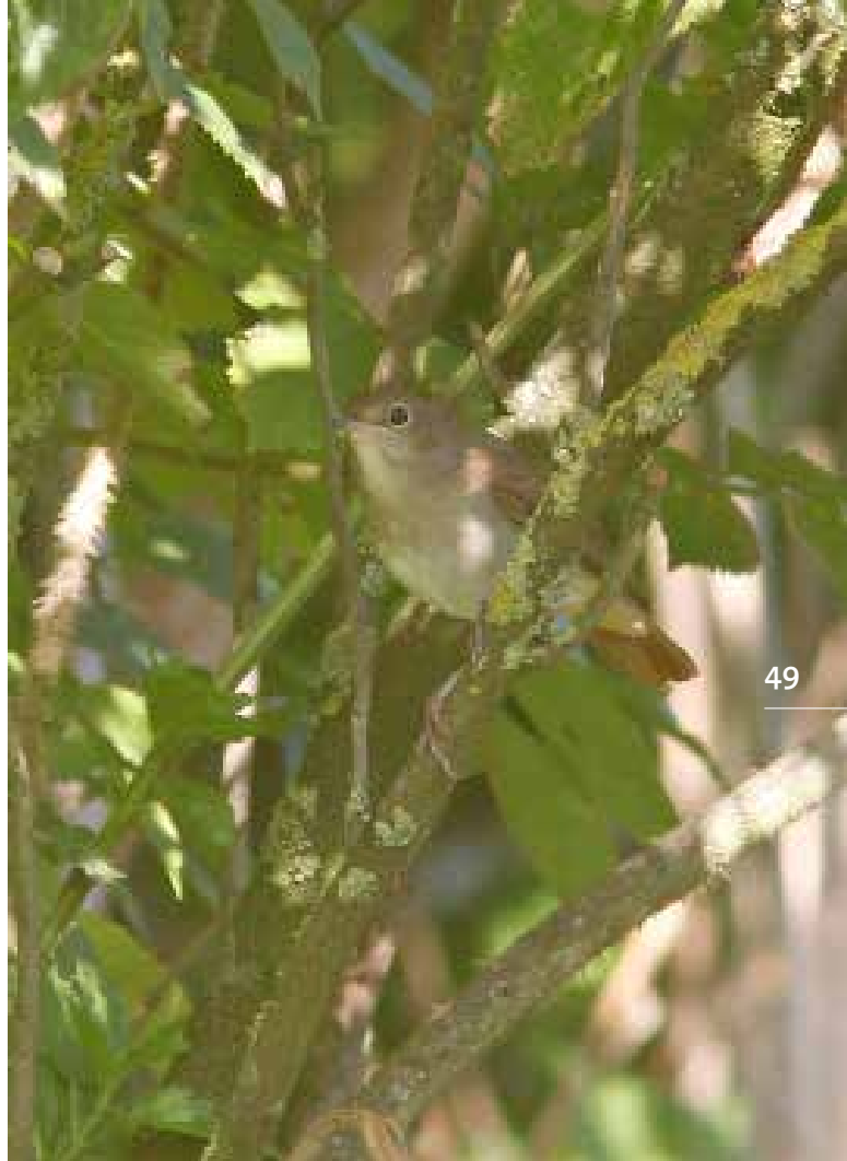
Nachtegal , telpost De Puihoop, Coepelduynen, Katwijk aan Zee, 13 september 2018