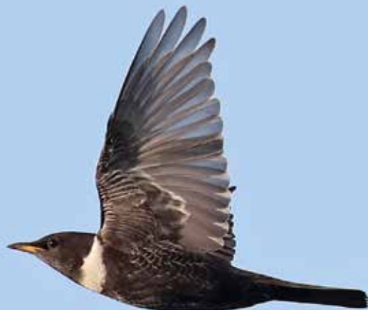
Beflijster ♂, telpost Berkheide, Wassenaar, 6 april 2018 | RENÉ VAN ROSSUM

Het hoogste dagtotaal: 4 ex over De Puinhoop op 17 november.