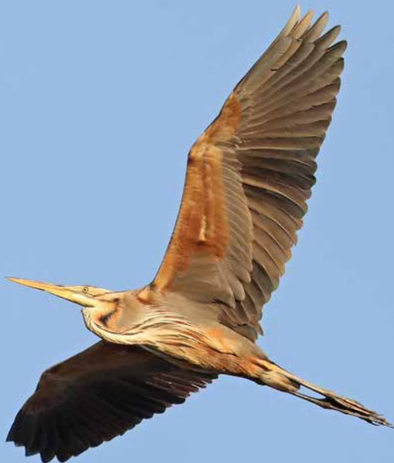
Purperreiger, adult, telpost Berkheide, Wassenaar, 24 mei 2018 | RENÉ VAN ROSSUM

er nog 3 geteld en deze eeuw geen territoria meer vastgesteld. Er zitten nog wel 'enkele' paartjes rond het Vliegveld Valkenburg.