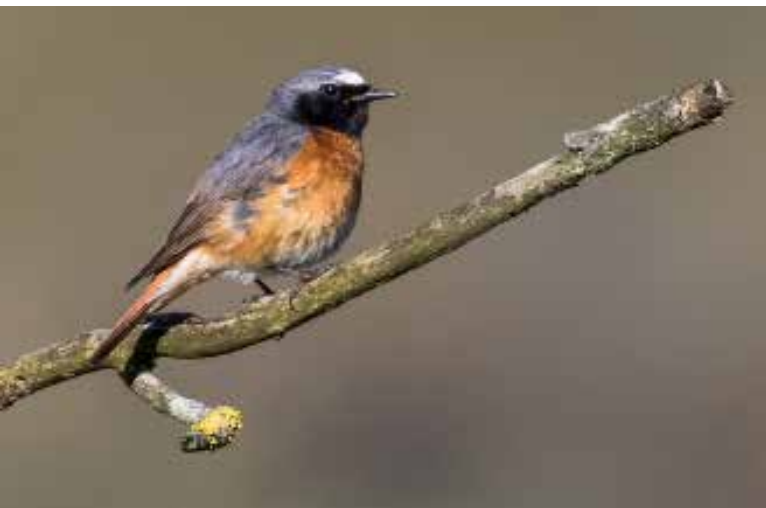
Gekraagde Roodstaart , nabij telpost Berkheide, Wassenaar, 4 mei 2018