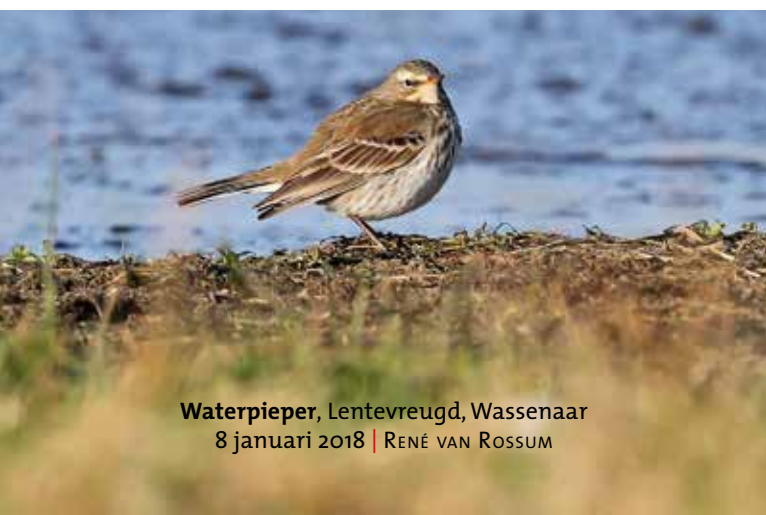
Waterpieper , Lentevreugd, Wassenaar 8 januari 2018 | RENÉ VAN ROSSUM