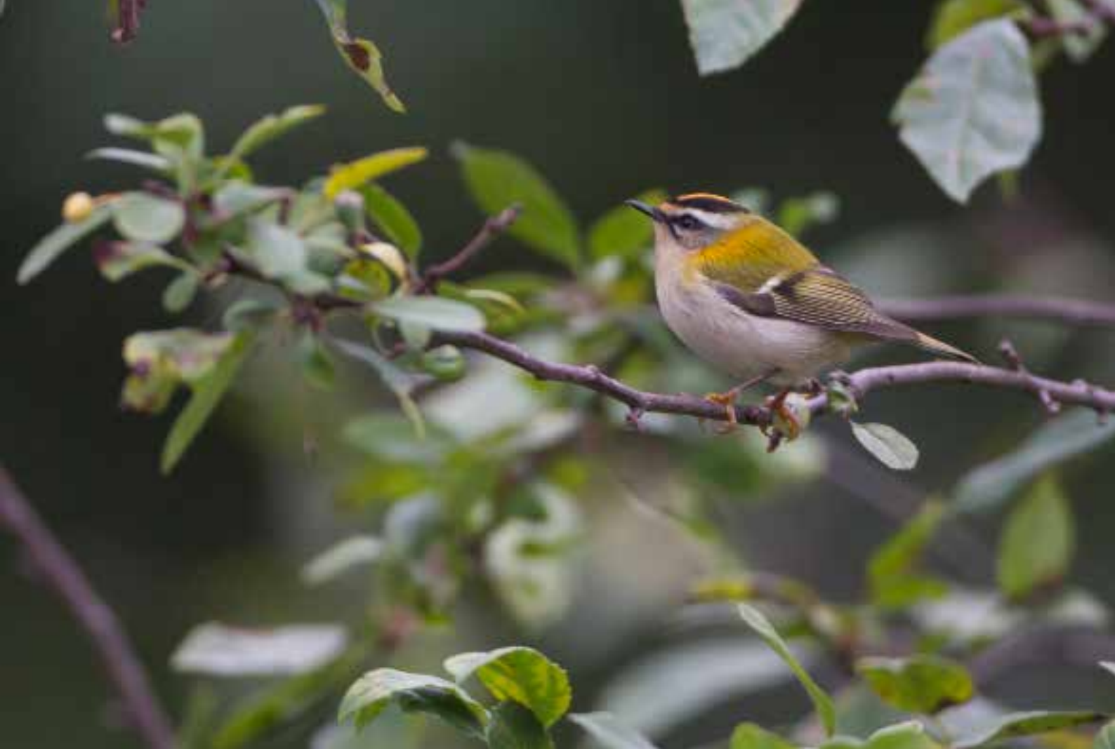
Vuurgoudhaantje , Rijnsoever, Katwijk aan Zee, 14 september 2018