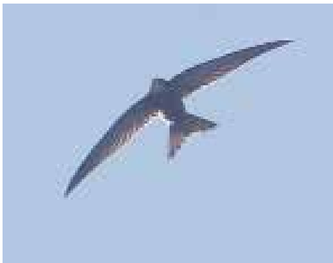
Vale Gierzwaluw, parkeerplaats nabij De Puinhoop, Coepelduynen, Katwijk aan Zee, 15 november 2018