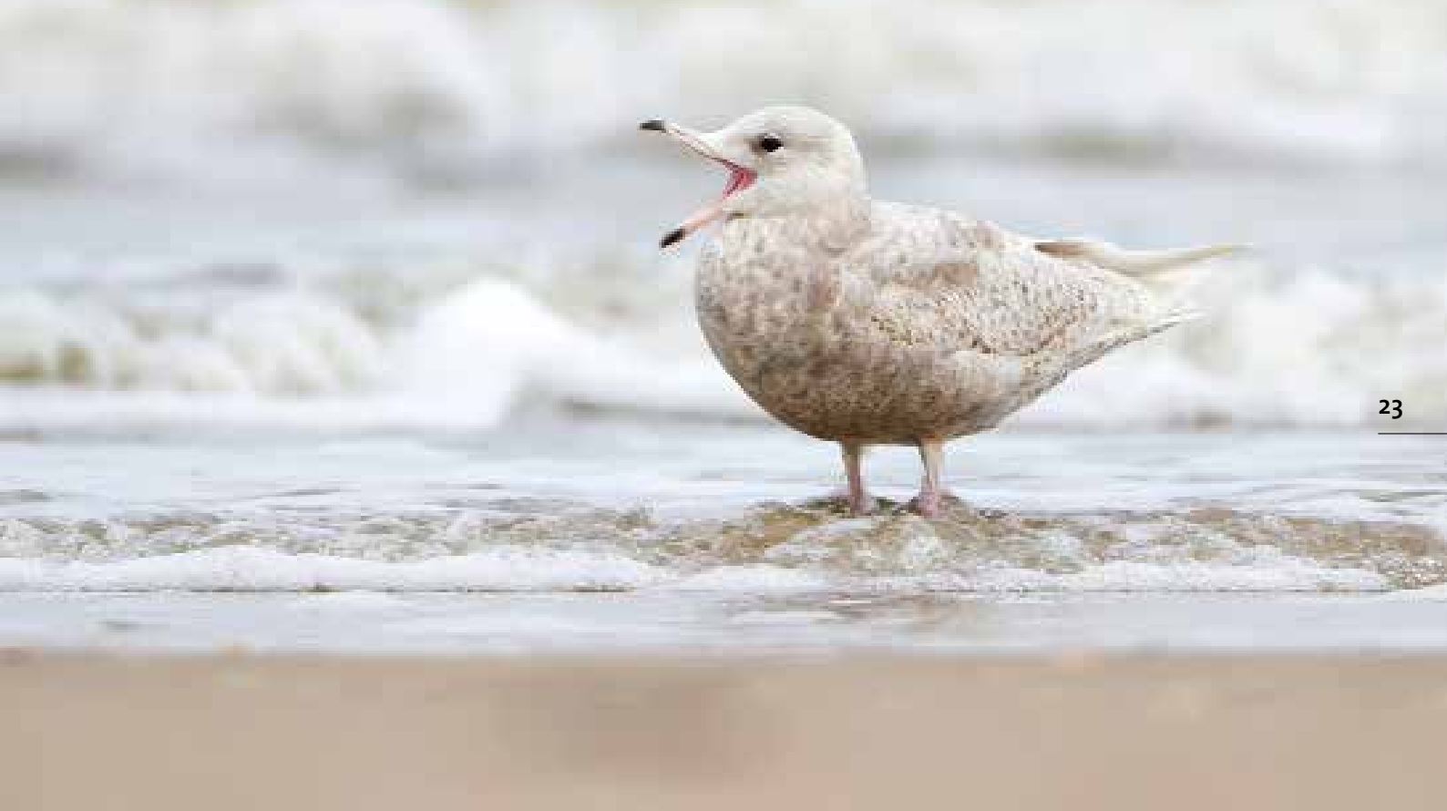
Grote Burgemeester , strand nabij de buitenwatering, Katwijk aan Zee, 27 april 2018

broeden ze ook in de buurt, bijvoorbeeld in Kokmeeuwenkolonies rond Alphen aan den Rijn en rond het IJsselmeer. Dat heeft natuurlijk zijn weerslag op de bij ons waargenomen aantallen. Vanaf maart vliegen ze, meestal in groepjes van vier tot tien, richting noord over de zeereep en Trektelpost Berkheide. Vanaf begin juli verschijnen de juvenielen; begin augustus zelfs een zestal ter plaatse rond de Uitwatering. Eind oktober zijn ze allemaal weer verdwenen.