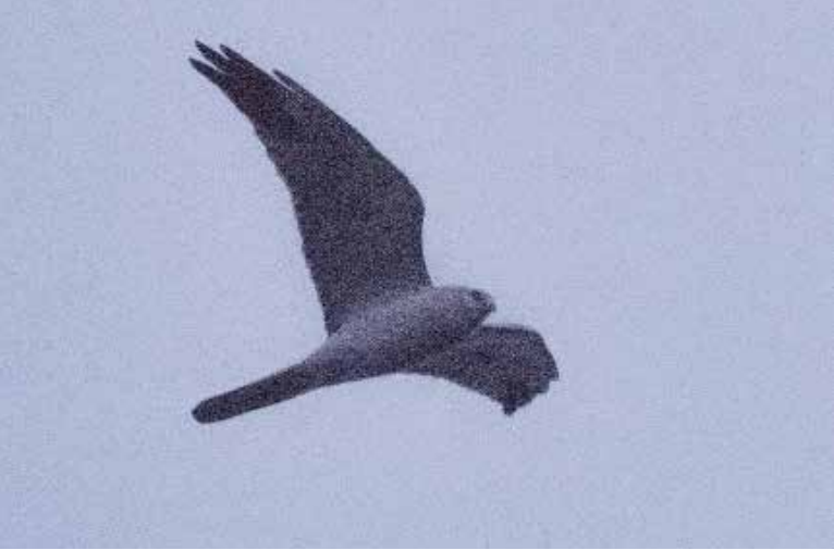
Steppekiekendief ♂, 06.12 uur, De Klip, Wassenaar, 7 april 2018 | MARK BOS