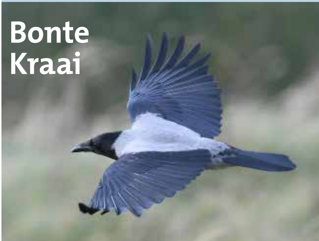
Bonte Kraai, Lentevreugd, Katwijk/Wassenaar, 11 november 2018