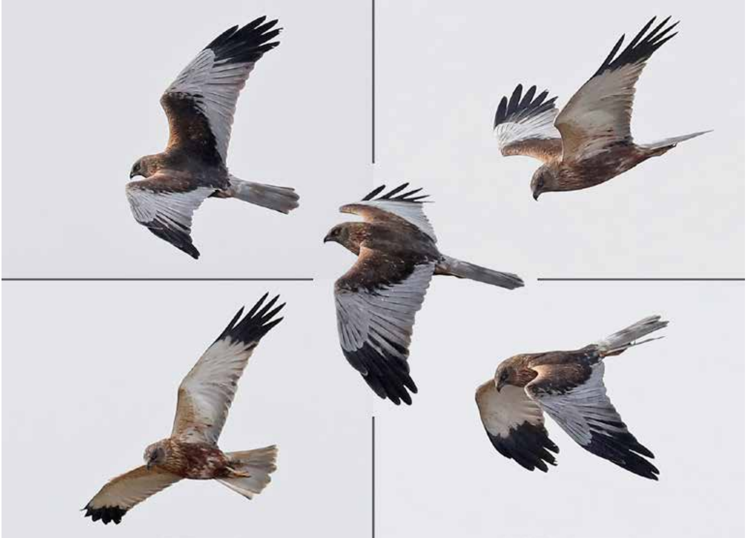
Bruine Kiekendief ♂, telpost Berkheide, Wassenaar, 15 maart 2018 | RENÉ VAN ROSSUM