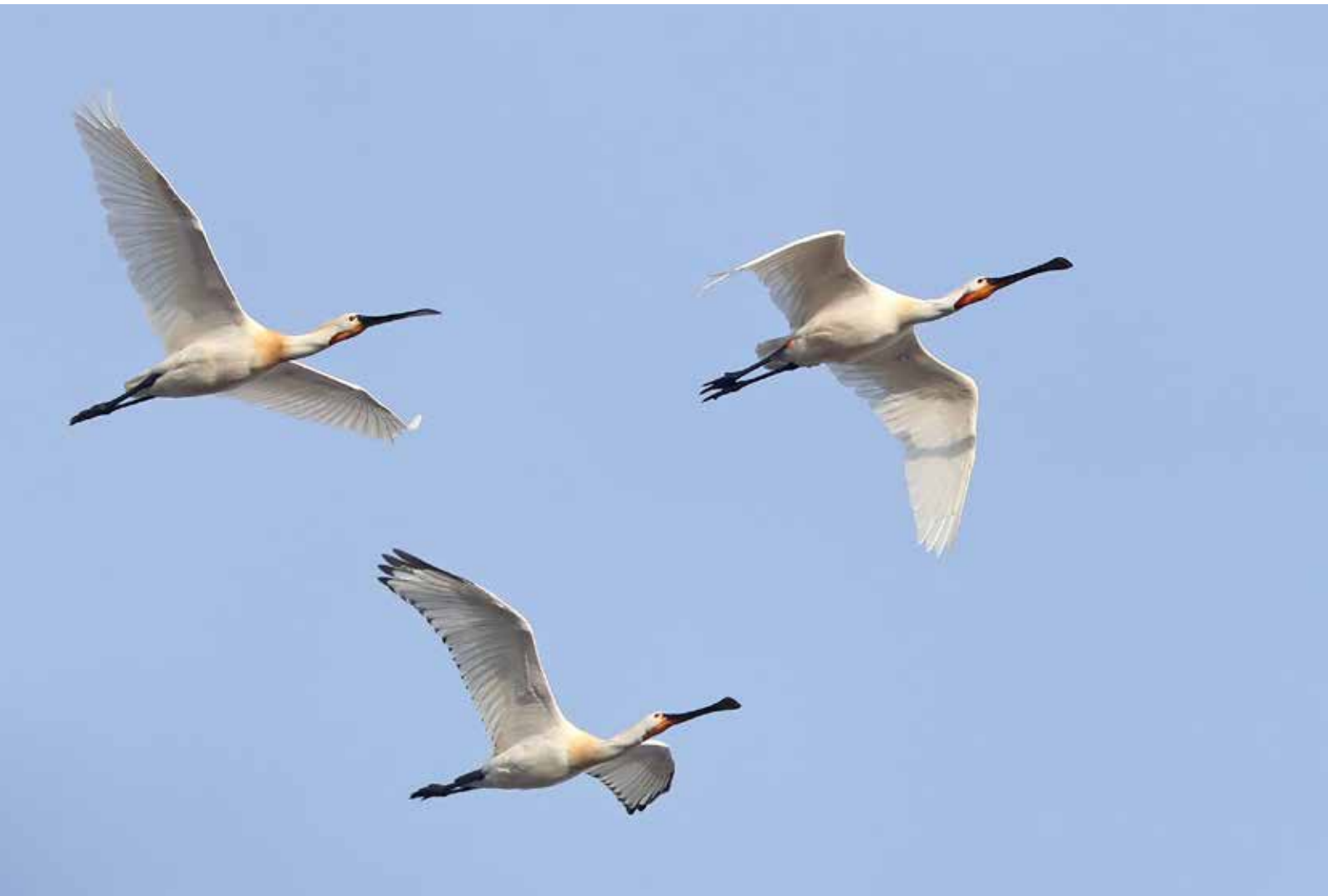
Lepelaars , telpost Berkheide, Wassenaar, 30 maart 2018