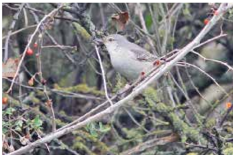
Spierwergrasmus , de Puinhoop, Coepelduynen, Katwijk aan Zee, 15 oktober 2018