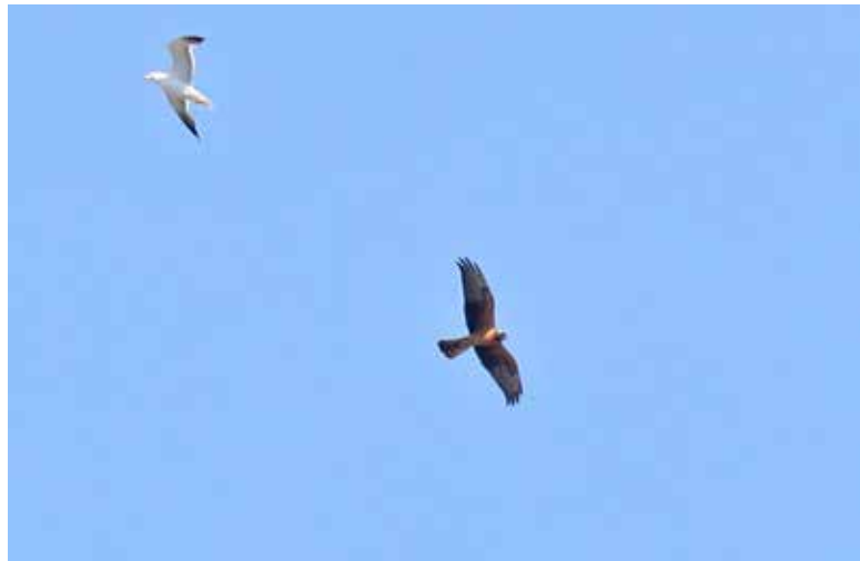
Grauwe Kiekendief , 1e kj, Katwijk aan den Rijn, 6 augustus 2018